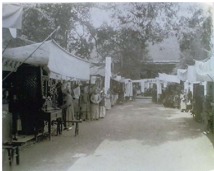
▲1911 年商業勸工會中賣農具的圖片

勸工會，由全省工商各界及公私團體出品赴會。民國時期四川省政府也督導地方政府積極參加並派員參與籌辦商業勸工會。據《青羊宮花會徵集物品規則》載，民國 8 年 11 月 24 日，楊庶堪省長令東川道道尹說：青羊宮、二仙庵兩廟每年陰曆二月向有花會，自前清光緒末葉先後開辦商業勸工會，由全省工商各界及公私團體出品赴會。其時各屬農工商礦各機關及各縣勸業分所約略完備，獎勵提倡，不遺餘力，商情鼓舞，成效已彰。還指出，振興實業尤以此為切要；現在時局平，各縣實業所次第成立，應設立勸工農蠶各局場，均經通令整頓振興宣導職有專司，其他各項實業機關亦已先後設法整理，所有來年花會自應酌量擴張，以鼓勵農工商礦各業之進行。值陰曆秋末，會期轉瞬即界，自應先行籌備，會場事宜屆期應派員籌辦，且由本公署制定徵集物品規則十二條，應行注意事項六條，實業機關即由主管主任