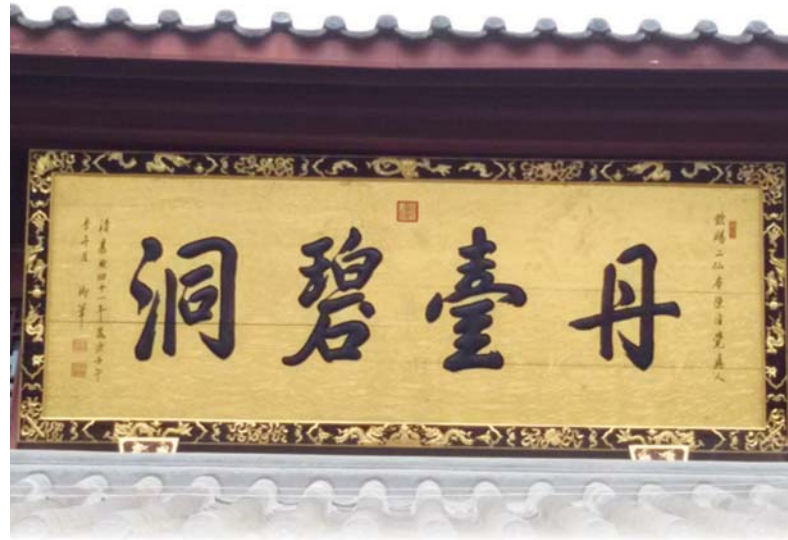
▲ 康熙親書“丹臺碧洞”

清嘉慶十九年（1814），四川省布政使方積請准飾建四川省崇祀呂洞賓專祠於二仙庵之呂祖殿。嘉慶九年，敕加封呂洞賓為“燮元贊運警化孚佑帝君”，列入國家祀典，每年春秋二次祭祀。嘉慶皇帝要求各省都要建專祠祀呂洞賓。四川省布政使方積認為沒有必要新建專祠，決定在已有宮觀裏落實。查訪成都府裏宮觀，原有的純陽觀已經毀壞，於是乎決定把二仙庵呂祖殿建成四川省崇祀呂洞賓專祠。方積見二仙庵“年祀既久、風雨所侵，井幹庸庀，桷廡彫剝，花殘鷺沼，煙輟龍香，石徑苔埋，霉梁蠹蝕”。 5 報請當時四川總督常明撥款重建呂祖殿，專祀呂祖。自此以後，二仙庵之呂祖殿便成為四川省崇祀呂洞賓專祠。